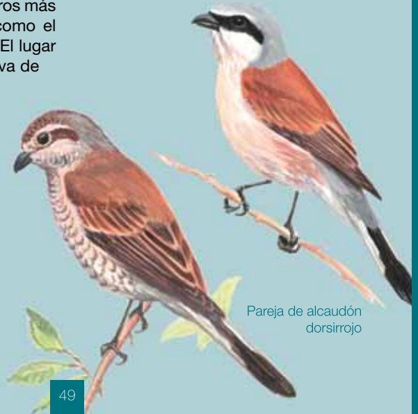
Pareja de alcaudón dorsirrojo

biente de campiña bien conservado, y la pista se rodea de robles, encinas y laureles. La calidad ambiental de esta zona concreta mejoraría notablemente recuperando el bosque natural de robles, sauces y alisos, en unas 4 hectáreas en torno al arroyo y la pista, a costa del extenso eucaliptal. Sobre el barro, hallaremos testimonio de las andanzas nocturnas del tejón y el jabalí, en base a sus huellas.